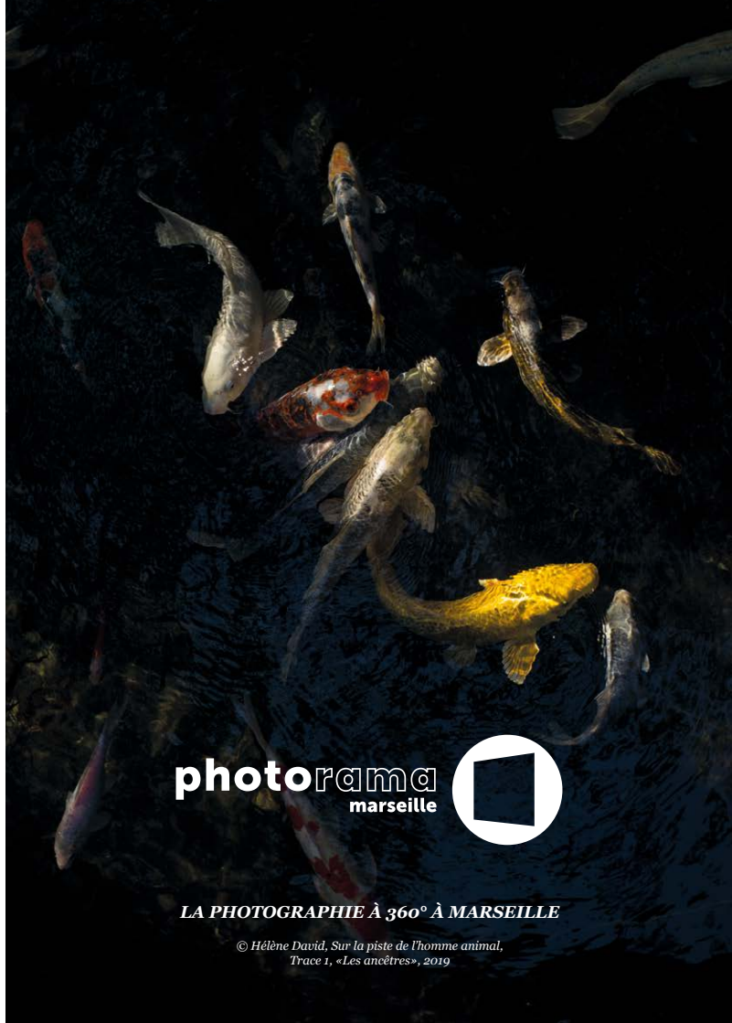
photo rama marseille